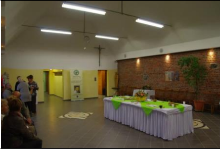
La salle rénovée