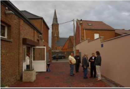
Bâtiment « la Providence »