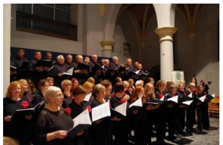
La chorale « Rencontre »

publics qui souvent s'ignorent ! Là est le nouveau défi de l'équipe responsable. Faire d'une demande d'aide un lieu de fraternité, permettre que ceux qui sont dans le besoin à un moment donné soit aussi dans la capacité à donner d'eux-mêmes, leur permettre de faire valoir leur savoir-faire afin qu'il n'y ait plus de « bénévoles » et de « bénéficiaires » mais réellement des hommes et des femmes mus par l'amour de Dieu qui nous aime en tant que Père ; ainsi ce crée la fraternité voulue par Dieu.