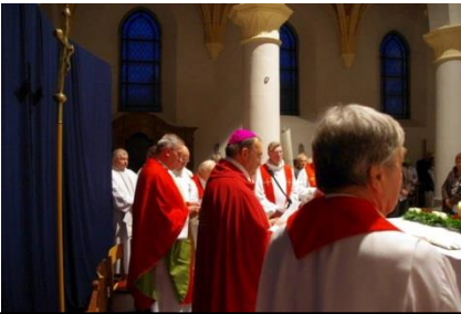
Messe d'action de grâce