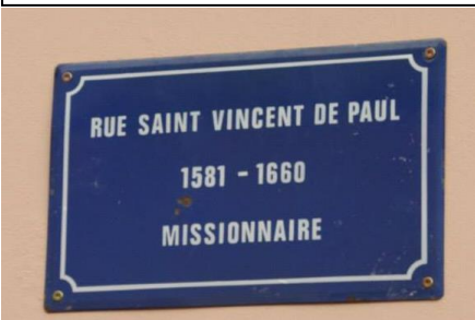
Plaque de rue dénichée sur internet !!!