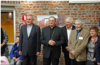
Le Visiteur de Pologne et l'évêque du diocèse